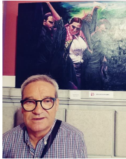
El autor posando con su obra