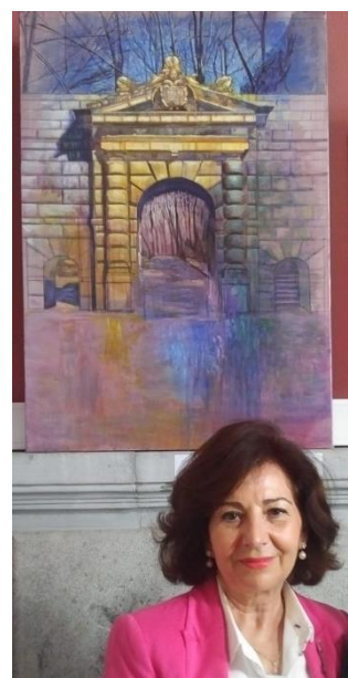
La autora posando con su obra