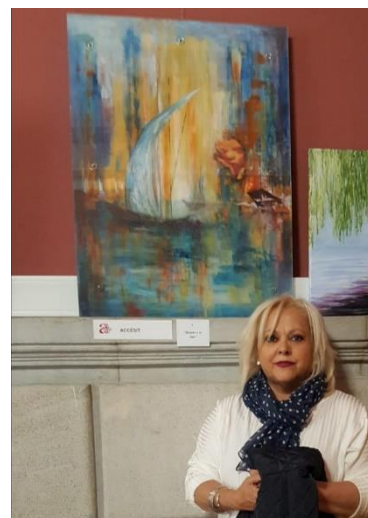
La autora posando con su obra