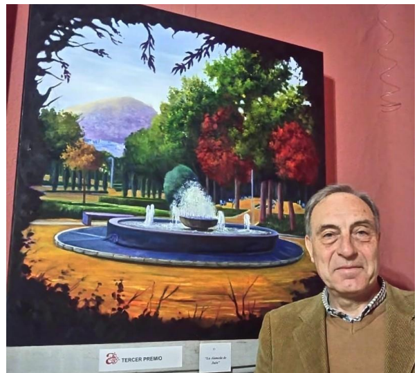
El autor posando con su obra