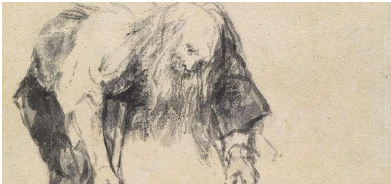
DIBUJOS: “SOLO LA VOLUNTAD ME SOBRA “