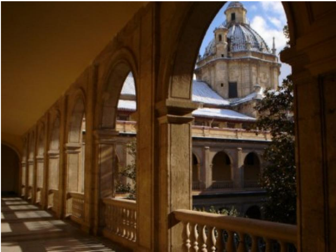
Colegio Mayor Santa Cruz la Real

APUNTARSE EN ALUMA O POR WASSAP en horario de oficina