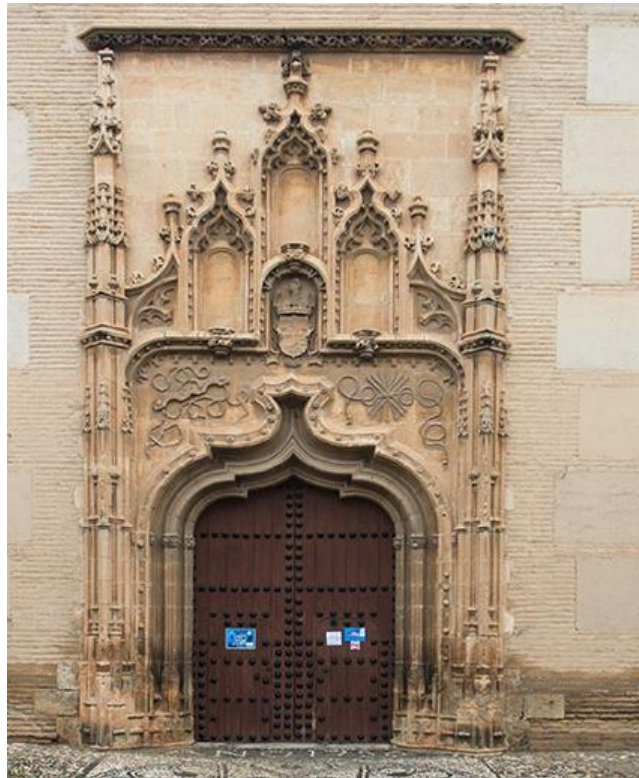
PORTADA IGLESIA – MONASTERIO DE SANTA ISABEL LA REAL

El Monasterio de Santa Isabel La Real , está enclavado en pleno corazón del barrio del Albaicín, dentro de un marco incomparable. En su entorno más cercano se encuentran bellas construcciones, como son el palacio de la Dar Al-Horra, la iglesia de San Miguel bajo, o la Puerta de Monaita.