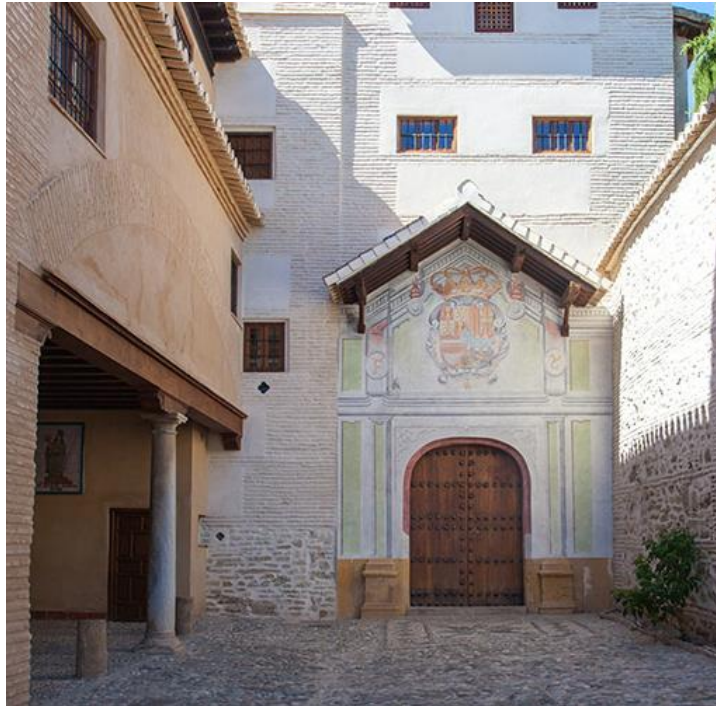
PORTADA REGLAR – CONVENTO DE SANTA ISABEL LA REAL

el compás del convento y la Iglesia, por otro, la zona conventual, que tiene como centro un precioso claustro monumental a cuyos lados se sitúan las zonas de clausura.