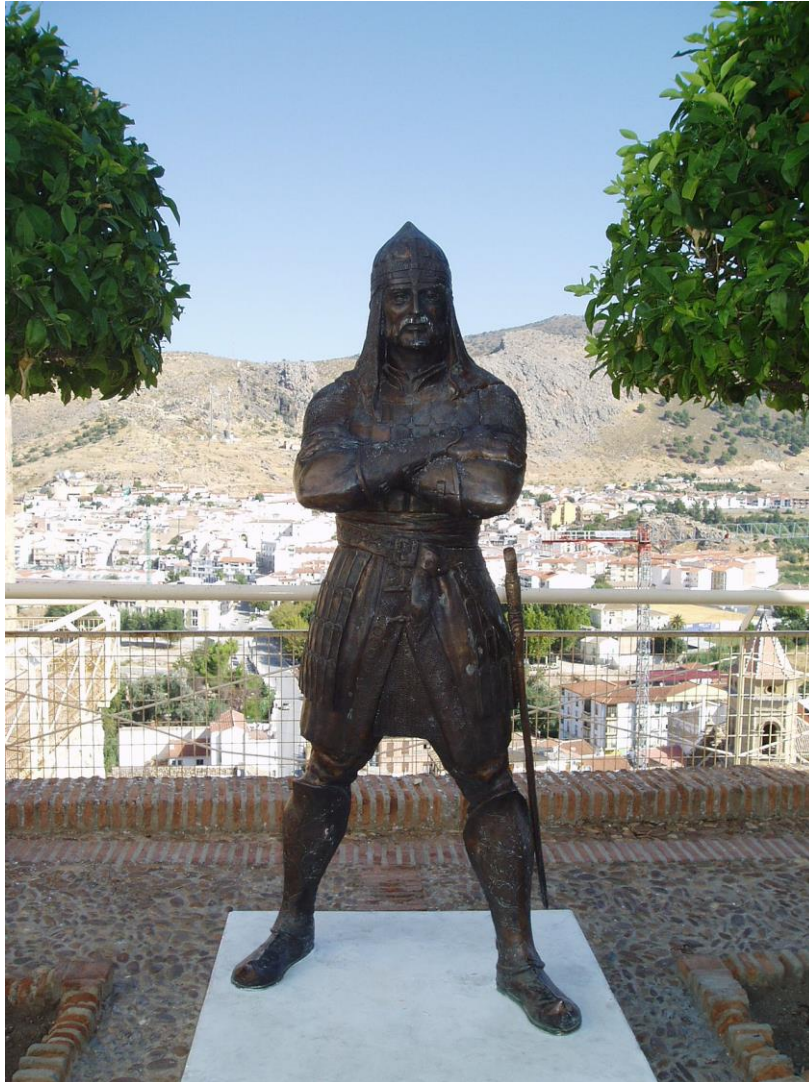
Monumento a Aliatar. Loja